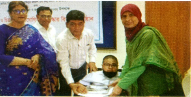
২৬ মার্চ মহান স্বাধীনতা ও জাতীয় দিবস ২০২২ উপলক্ষে আয়োজিত প্রতিযোগিতার পুরস্কার ও সনদ বিতরণ অনুষ্ঠান