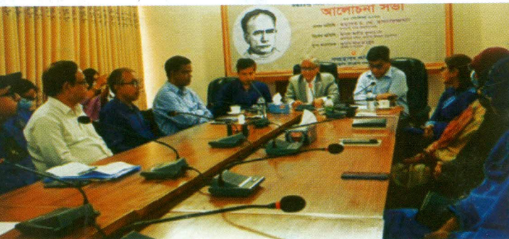
বাংলা সাহিত্যের জনক ও সমাজ সংস্কারক ঈশ্বরচন্দ্র বিদ্যাসাগরের জন্মদিবস উপলক্ষে আলোচনা সভা