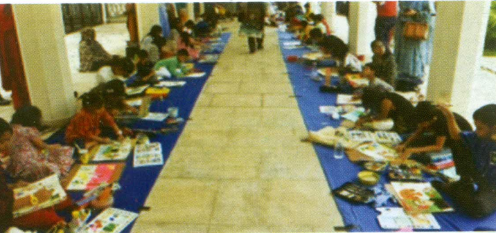
জাতীয় শোক দিবস উপলক্ষে আয়োজিত চিত্রাংকন প্রতিযোগিতা