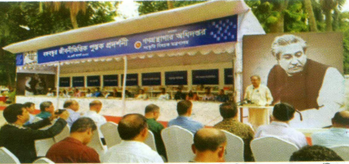
১৫ আগস্ট জাতীয় শোক দিবস উপলক্ষে বঙ্গবন্ধুর জীবনীভিত্তিক পুস্তক প্রদর্শনী