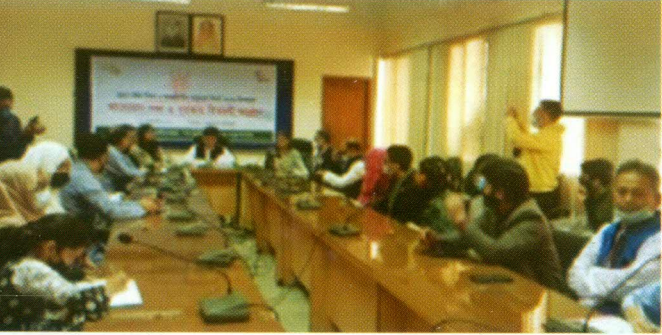
ফেব্রুয়ারি আন্তর্জাতিক মাতৃভাষা দিবস ২০২২ উপলক্ষে আলোচনা সভা