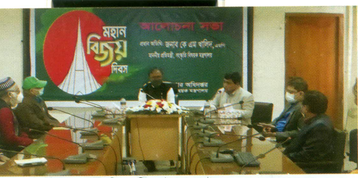
১৬ ডিসেম্বর মহান বিজয় দিবস উদযাপন উপলক্ষে আলোচনা সভা