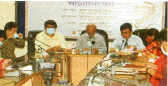
মাতার পিতা বঙ্গবন্ধু শেখ মুজিবুর রহমানের জন্মদিবস উপলক্ষে আলোচনা সভা